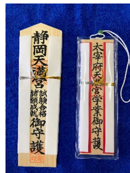
合格・学業成就祈願（Jan. 4）