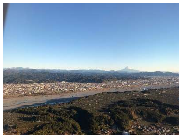
富士山静岡空港上空から（Nov. 25）